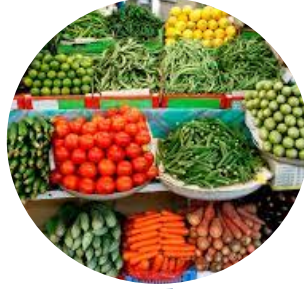
أنواع الأسواق في الامارات