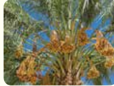
6. شجرة النخيل