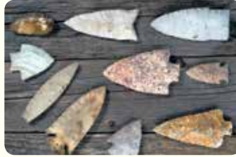
زؤوس رماح قديمة

سنتعرّف الآن إلى قطعة أثرية تاريخية حقيقية. تحدّث مع مجموعتك وشاركهم الأفكار حول القطعة الأثرية ومصدرها واستخداماتها قديماً. تذكّر أن تختار أحد زملائك لتدوين الأفكار الناتجة من مناقشات المجموعة.