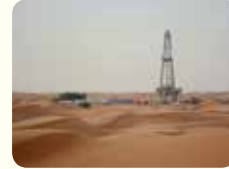
5. اكتشاف النفط