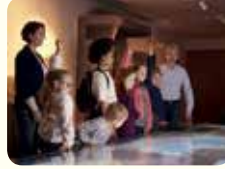
3. رحلة إلى المتحف