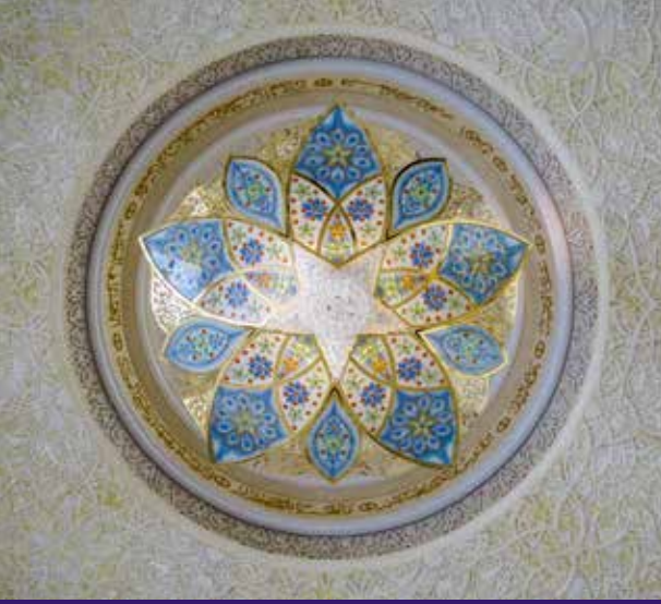
مستوحى من جامع الشيخ زايد الكبير، أبوظبي

تصميم يعكس مفاهيم الثقافة المحلية والمجتمع المعاصر والمواطنة العالمية.