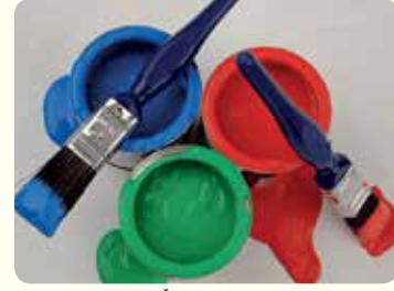
دلي وفرش الطلاء