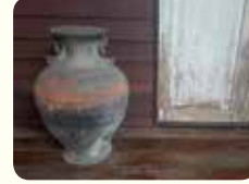
2. إناء قديم