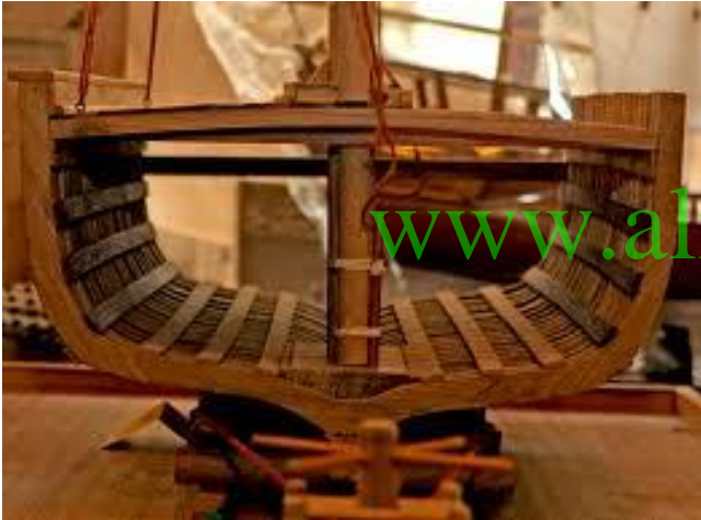
2- تركيب ألواح الفينة