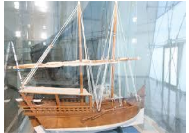
3- تركيب سارية السفينة