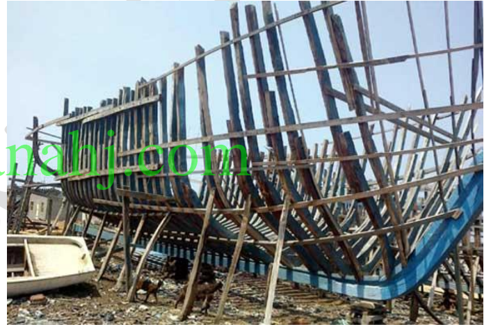
1- إنشاء الهيكل الخارجي للسفينة