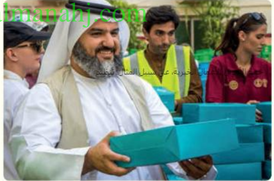
عمل الخير يجمعنا الخيرية، عن مسيل المثال: تنظيم

• القيام بعمل لطيف لجار أو صديق - إطلاق مزحة، حمل