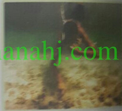
لسموي على اللؤلؤ