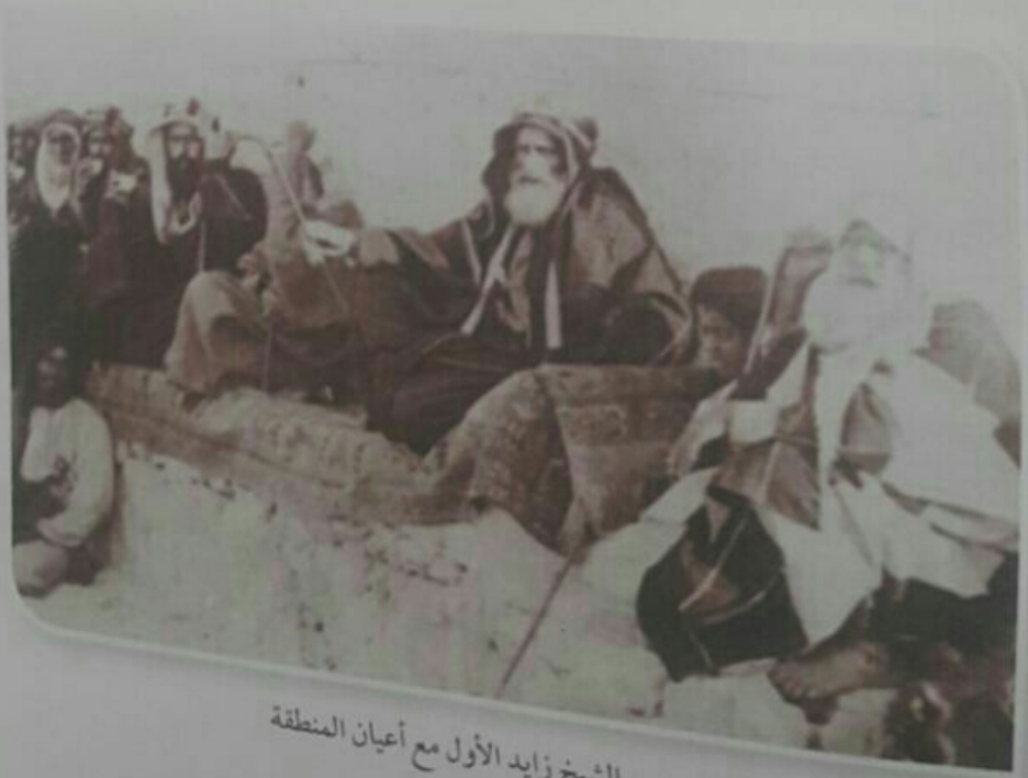
الشيخ زايد الأول مع أعيان المنطقة